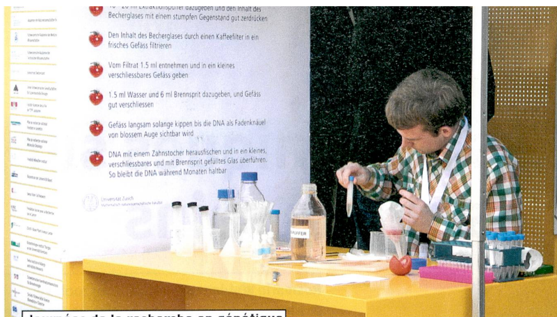
Journées de la recherche en génétique