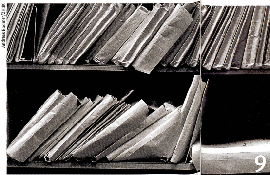
Garantes de l'Etat de droit, les archives peuvent aussi être utilisées à mauvais escient.