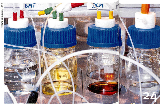
Vaccin contre la malaria: des espoirs grâce à du sucre fabriqué au moyen d'une machine révolutionnaire.