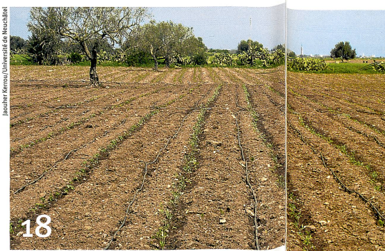
Indispensable à l'agriculture, l'eau des nappes phréatiques est un bien menacé.