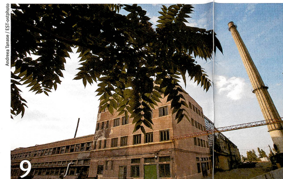
En Roumanie, d'anciennes industries hypothèquent la santé de la population.