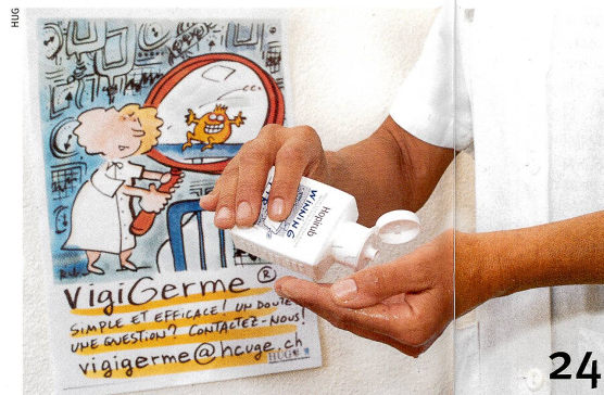
A l'hôpital, une bonne hygiène des mains sauve des vies.