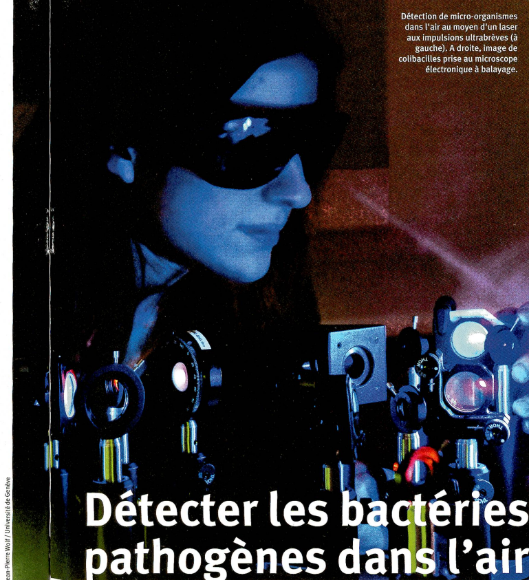
Jean-Pierre Wolf / Université de Genève

S'il est relativement aisé de distinguer la première catégorie des deux autres, il est beaucoup plus difficile de faire la différence entre les grains de suie et les bactéries qui ont des compositions chimiques très semblables. Tous sont constitués de «composés aromatiques polycycliques» - des molécules formées de cycles d'atomes de carbone. Toutefois, dans les micro-organismes, ces cycles sont munis de «bras» d'acides aminés,