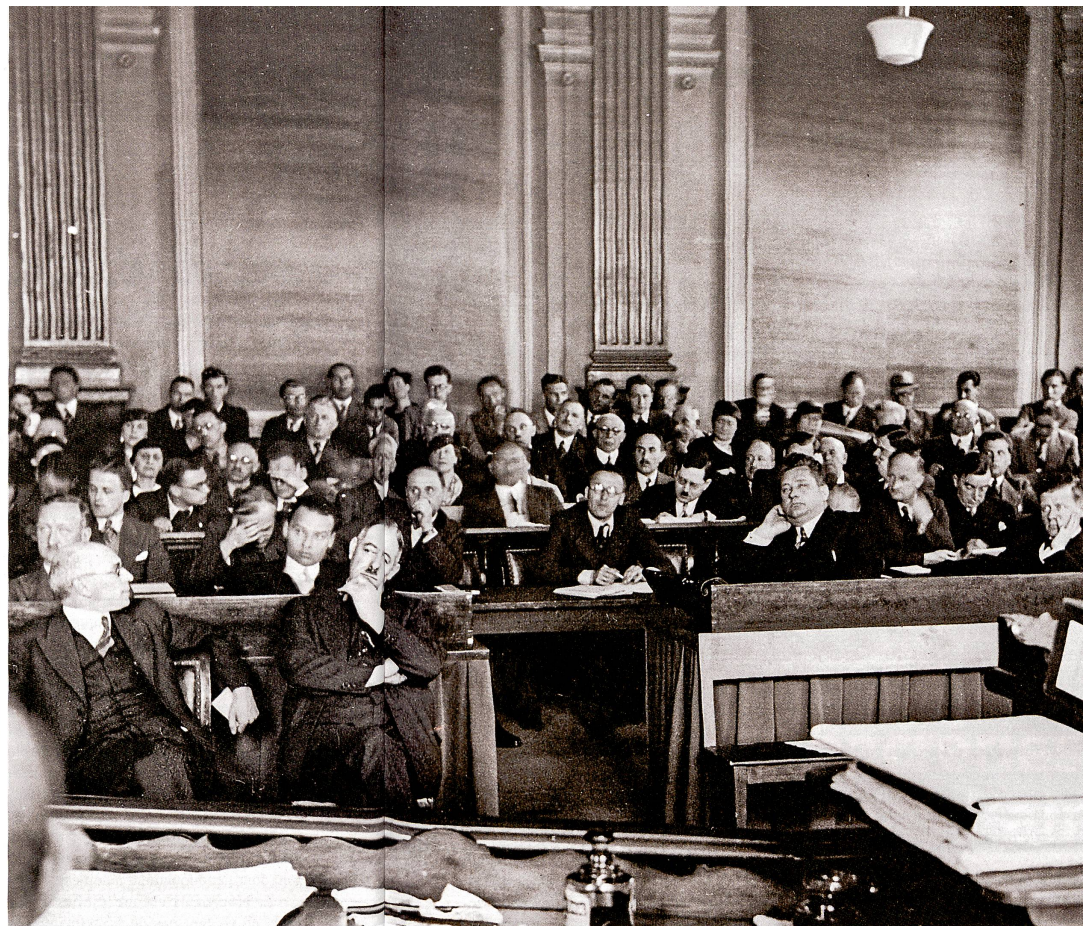
Tout à gauche : le propagandiste nazi et défenseur des accusés Ulrich Fleischhauer. Au milieu : dans la salle du Tribunal de district de Berne. En bas : couverture d'une édition française des « Protocoles des Sages de Sion », en 1934.