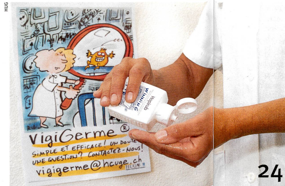
24 A l'hôpital, une bonne hygiène des mains sauve des vies.