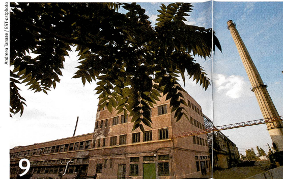
9 En Roumanie, d'anciennes industries hypothèquent la santé de la population.