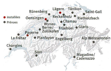
Sites des stations de mesures SwissSMEX Carte: Swisstopo/Studio2s, LoD

Ces résultats ont eu l'honneur d'une publication dans la revue Nature , mais restent le fruit d'une modélisation. « Depuis une dizaine d'années, les scientifiques ont vraiment pris la mesure de l'importance de ce paramètre qu'est l'humidité des sols. Des initiatives se mettent en place pour obtenir