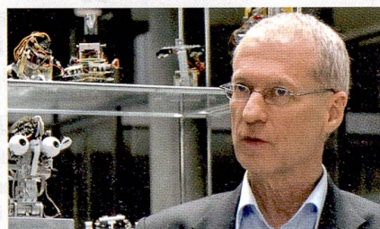
Le roboticien Rolf Pfeifer.

SCIENCEsuisse combine 25 courts métrages et une publication richement illustrée, le tout en quatre langues. Ces 25 portraits montrent combien la curiosité est le carburant des chercheurs, ces passionnés motivés à lever le voile sur de nouvelles parcelles d'inconnu. La série donne un panorama varié de la place scientifique suisse. Elle offre un aperçu des principaux thèmes sur