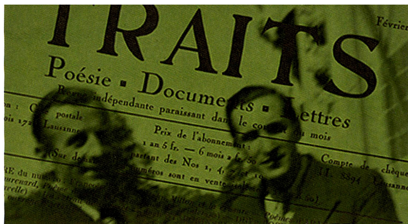
Musée historique de Lausanne, Mémorial de la Shoah

Questions et réponses sont tirées du site du FNS www.gene-abc.ch qui informe de manière divertissante sur la génétique et la technologie génétique.