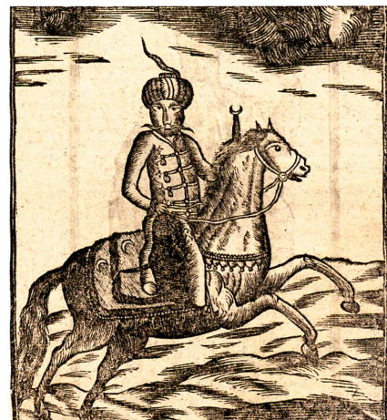
Une illustration représentant des guerriers turcs dans l'almanach d'Appenzell datant de 1771.

Il s'agit en effet d'une molécule de régulation, indispensable à la maturation normale du système nerveux. C'est la première fois qu'une relation est établie entre une protéine associée au développement cérébral normal et la maladie d'Alzheimer, c'est-à-dire un processus dégénératif. Cette constellation a priori déconcertante offre aussi certaines chances. Il existe des substances utilisées dans le cadre de traitements contre le cancer qui visent les LRP6. Ce qui pourrait éventuellement aussi représenter une base pour un traitement de la maladie d'Alzheimer. Roland Fischer