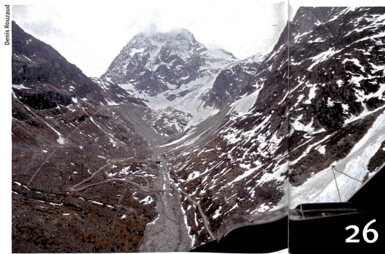
Les effets du réchauffement climatique sur les ressources en eau dans les Alpes.

Photo de couverture en haut : Le pédopsychiatre Hans-Christoph Steinhausen