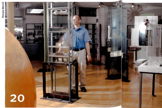
La science descend dans l'arène publique.