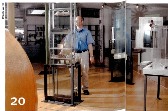
La science descend dans l'arène publique.