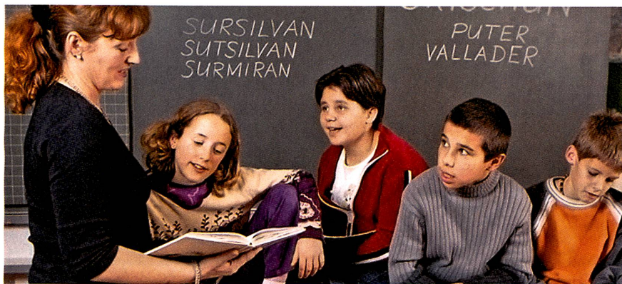
Elèves apprenant en 2003 le romanche dans une école primaire des Grisons.