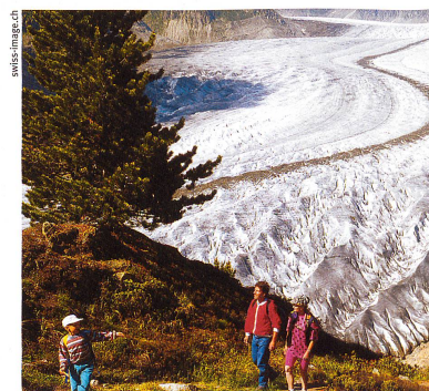
Les traces d'anciens glaciers ont permis, il y a 200 ans, aux géologues de faire des découvertes sur la formation de la Terre.