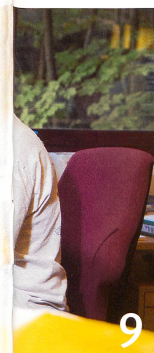
Photo de couverture en haut : Les locaux de Swiss-Prot.