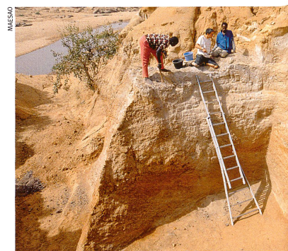
Au Mali, des archéologues ont découvert les vestiges de la plus ancienne céramique d'Afrique.