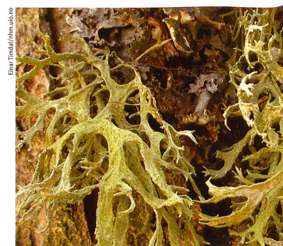
Les lichens recèlent encore beaucoup de mystères. Des chercheurs zurichois en ont élucidé quelques-uns.