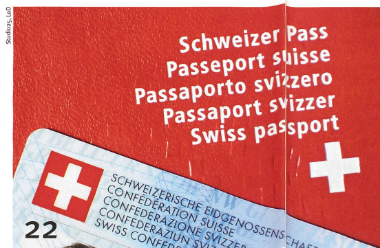
L'obtention du passeport suisse est une course d'obstacles.