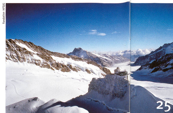
Jungfrauoch: la plus haute station de recherche d'Europe à 75 ans.

Photo de couverture en haut: L.-J. Sally Liu, directrice de recherche à l'Université de Bâle.