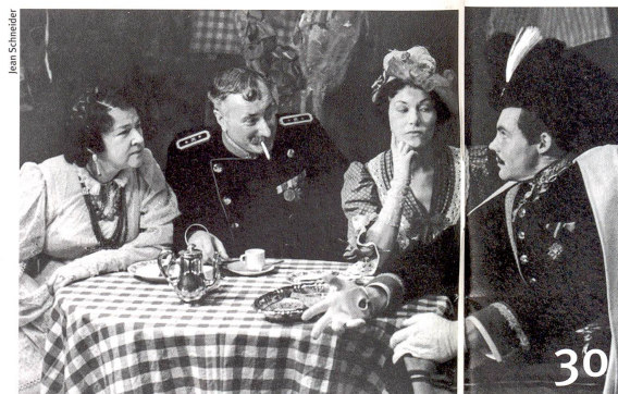
Le premier grand dictionnaire sur le théâtre en Suisse.