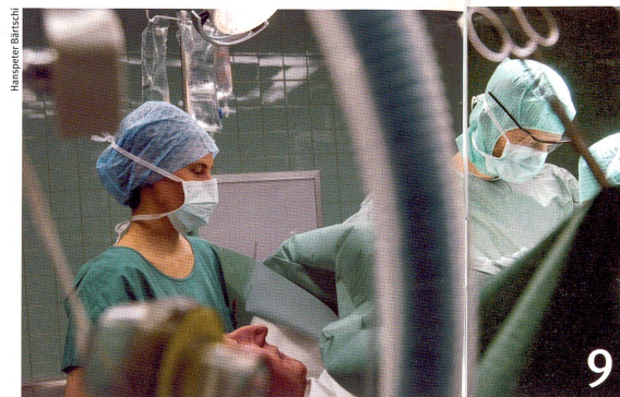
Chercheurs et médecins développent de nouvelles thérapies contre le cancer.