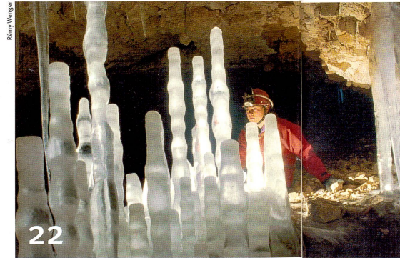
L'étude des glaciers du Jura donne de précieuses indications sur l'évolution du climat.