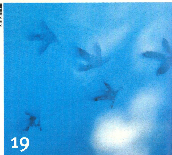
Grand tétras: des traces dans la neige qui deviennent rares.