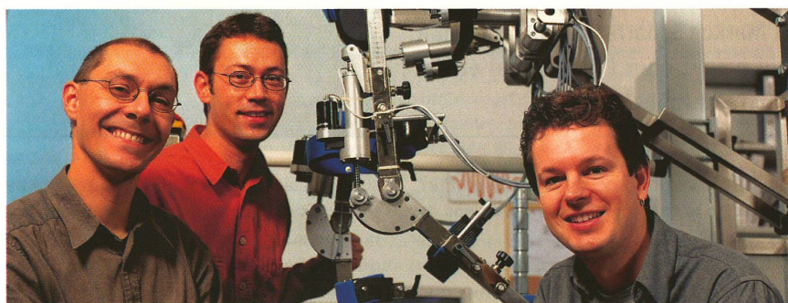
Les jeunes entrepreneurs de l'équipe Hocoma SA qui ont obtenu le prix Vigier en 2001.