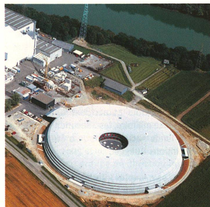
Le nouveau synchrotron Swiss Light Source du PSI.

*Une déformation est dite plastique lorsqu'elle est irréversible. Science , volume 304, pp. 273-276