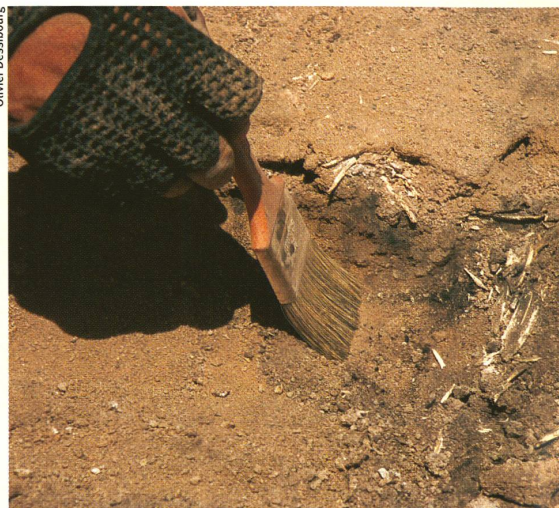
Au Chili, l'histoire du climat est étroitement liée à celle des peuples.