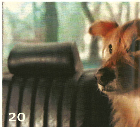
Un flair surnaturel ou la poésie dans la publicité.