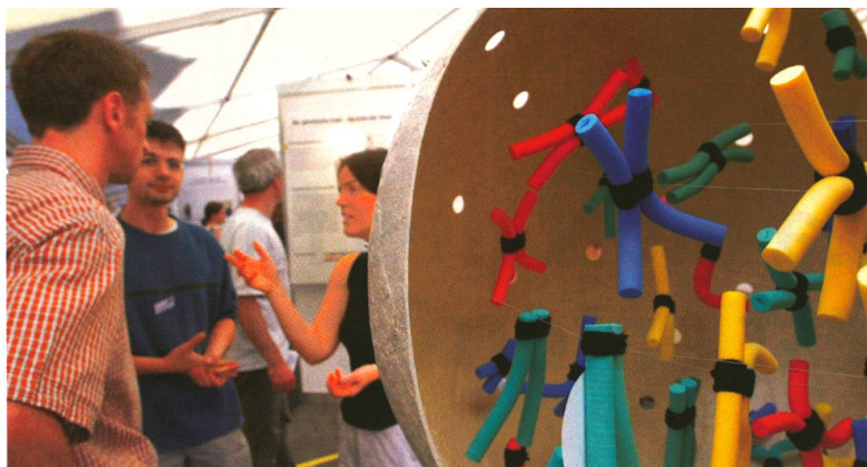
Discussion autour d'un modèle de noyau de cellule humaine avec chromosomes.

«Horizons», Fonds national suisse Wildhainweg 20, 3001 Berne fax: 031 308 22 65, E-mail: pri@snf.ch