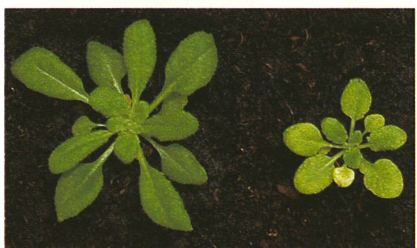
Les plantes qui ne peuvent transporter le sucre à l'extérieur des chloroplastes restent plus petites.

Les plantes ont l'air paisibles. D'importants processus métaboliques se déroulent pourtant à l'intérieur d'elles. Le jour, elles constituent des réserves d'énergie grâce à la lumière solaire et au CO 2 : du sucre pour l'usage immédiat et de l'amidon comme stock à long terme. La nuit, l'amidon est extrait et est également transformé en sucre. Celui-ci est non seulement utilisé par la cellule, mais est aussi exporté vers d'autres parties de la plante. L'équipe de Samuel Zeeman de l'Université de Berne a découvert, dans le cadre du Pôle de recherche national « Survie des plantes en milieux naturels et agricoles », une étape