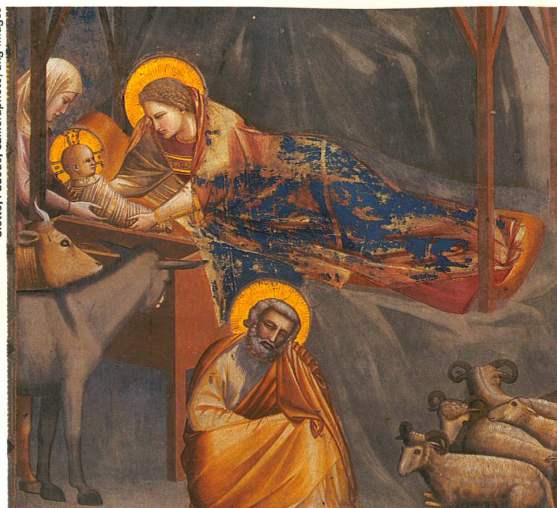
L'image de la Vierge à l'enfant est bien antérieure au christianisme.