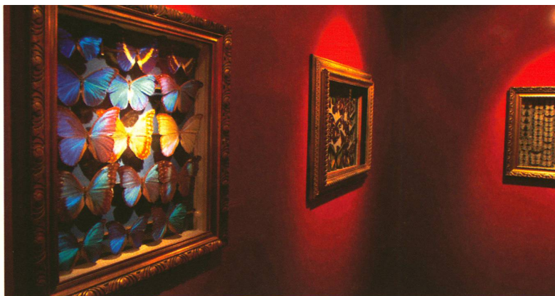
La collection d'insectes présente de véritables œuvres d'art.

Rédaction « Horizons », Fonds National suisse, Wildhainweg 20, 3001 Berne, fax: 031 308 22 65 E-mail: pri@snf.ch