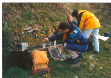
ARSENIC: même en Suisse, ce poison est parfois présent en trop grande quantité dans l'eau potable. Un danger pour la santé ?