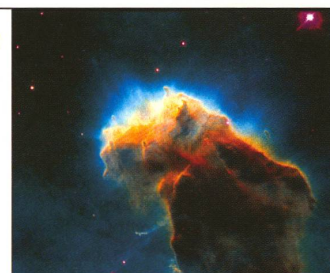
NOUVELLES DU COSMOS: les étoiles avaient autrefois une signification divine. Aujourd'hui, elles nous aident à comprendre l'origine de l'Univers.