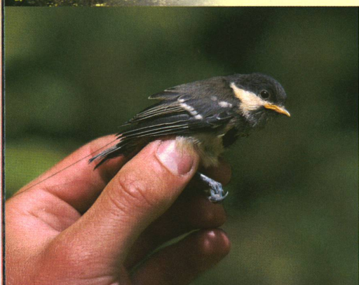
A l'aide d'un mini-émetteur (agrandi sur la photo de droite), les premiers vols d'essai des mésanges peuvent être suivis.

De nombreux animaux de la forêt vivent cachés, tels les mésanges charbonnières et les mésanges noires. Ce n'est qu'au moyen d'un mini-émetteur spécialement mis au point que les chercheurs de la station ornithologique suisse de Sempach ont pu suivre la destinée de jeunes mésanges.