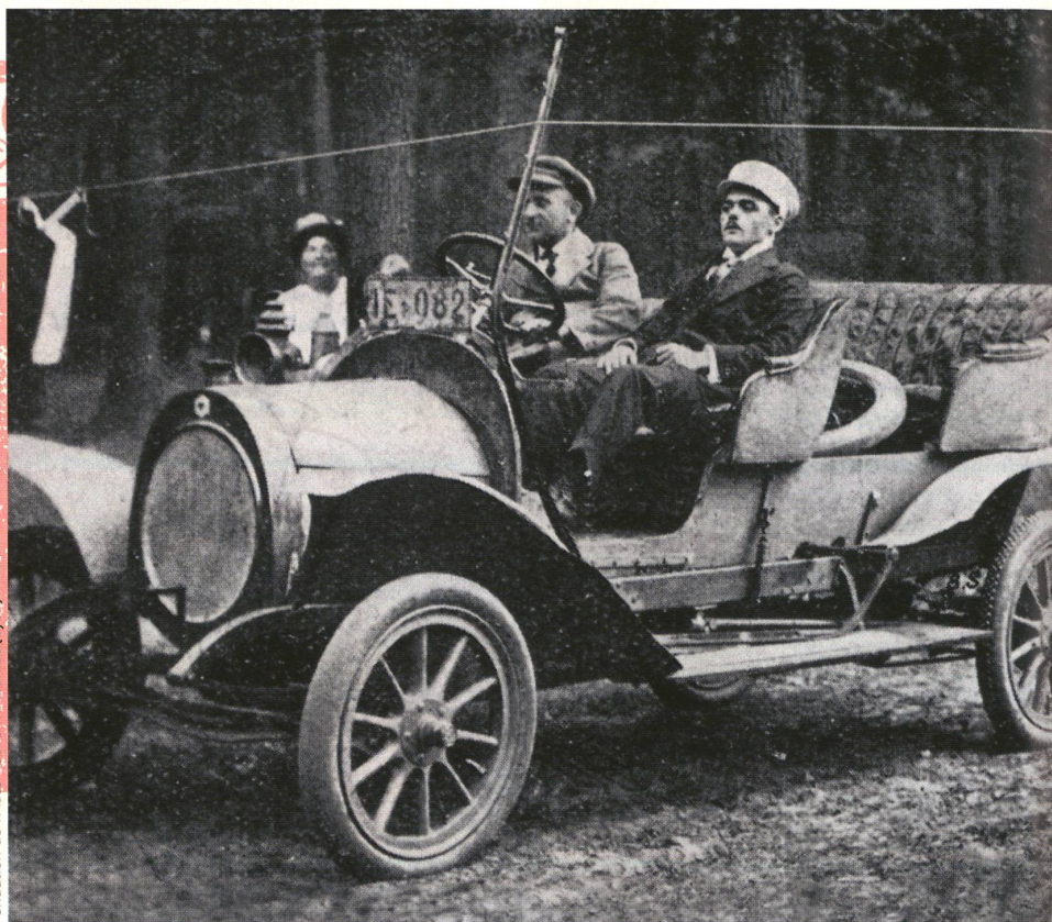
Fondation de l'Automobile M. Berliet (Lyon)

dépassait les 60 km/h sur de bonnes routes. Les voitures de course, elles, établissaient déjà le record de vitesse de 100 km/h en 1899, la barre des 200 étant atteinte en 1909. La vitesse maximale autorisée n'a pas manqué de devenir un thème très discuté: elle était de 30 km/h en 1904 dans la plupart des cantons (ce qui «permet au conducteur de rester maître de sa machine»). En 1911, elle passait à 12 km/h dans les localités et à 40 km/h en dehors. La mesure de référence était alors le trot d'un cheval. L'exigence d'installer des compteurs et d'organiser des contrôles a toujours été liée aux débats sur les limitations de vitesse. Celles-ci ont été provisoirement abolies en Suisse en 1932, mais les voitures devaient alors en contrepartie être équipées d'un «dénonciateur de vitesse».