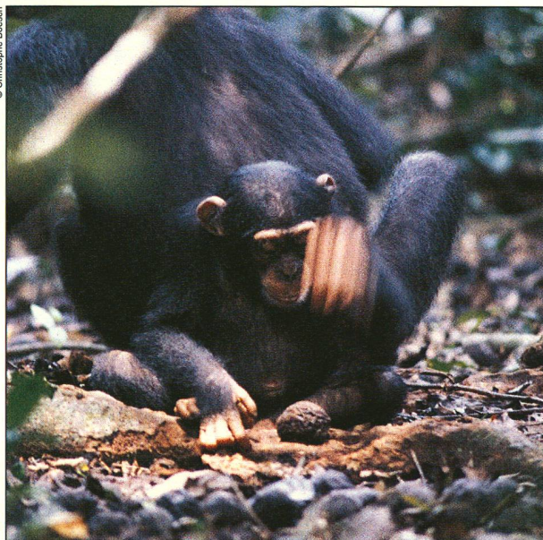
Une jeune femelle chimpanzé, âgée de 5 ans, s'essaie à casser une noix. Il faut les bons outils et beaucoup de pratique pour y parvenir.

La partie était pourtant loin d'être gagnée. Les sceptiques pouvaient toujours prétendre que ce comportement est lié à l'environnement, qu'il se développe spontanément là où il y a des noix, ou qu'il est tributaire de la génétique. Ce qui expliquerait pourquoi des chimpanzés d'autres régions d'Afrique persistent dans l'ignorance, bien que leur environnement soit riche en