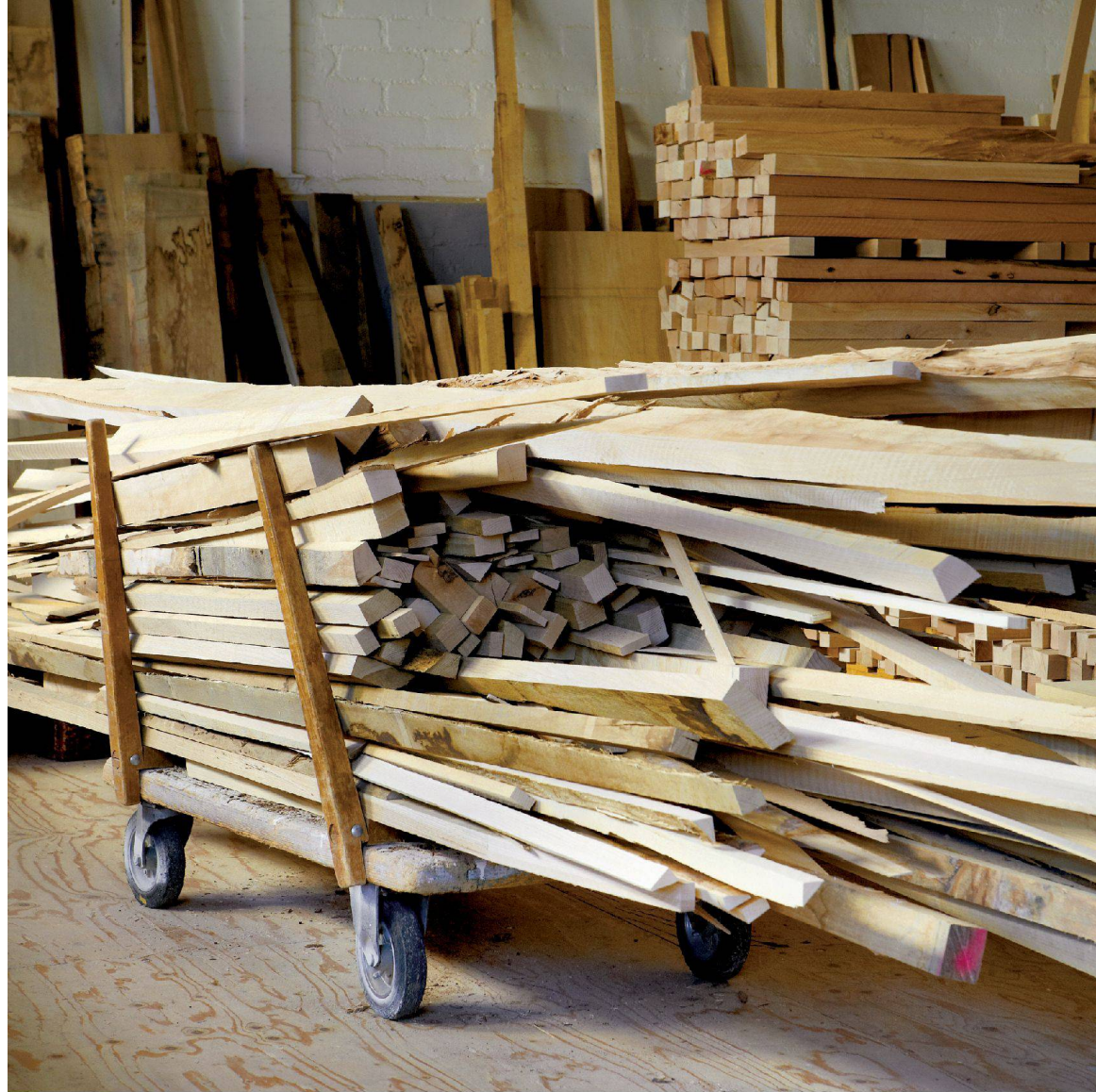
◀ In der Gewinnerwerkstatt: das Warenlager der Schreinerei Felma in Lyss.

einer steinalten Tradition zu verabschieden: «Design sind nicht wir. Das sind die andern. Mit denen aber spannen wir zusammen.» Buchhaltung, Geschäfts- und Mitarbeiterführung gehören zum Beruf, erst recht der Kern des Schreinerkönnens, die handfeste Umformung von Material. Die gestalterische Recherche und Konzeption aber, die Suche nach der Form geschieht zusammen mit Designern oder Architektinnen.