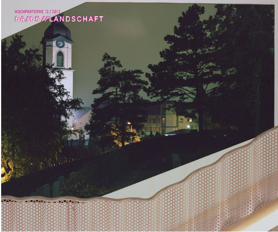
^Präzis ins Blech geschnittene Öffnungen geben Ausblicke auf die Stadt frei.