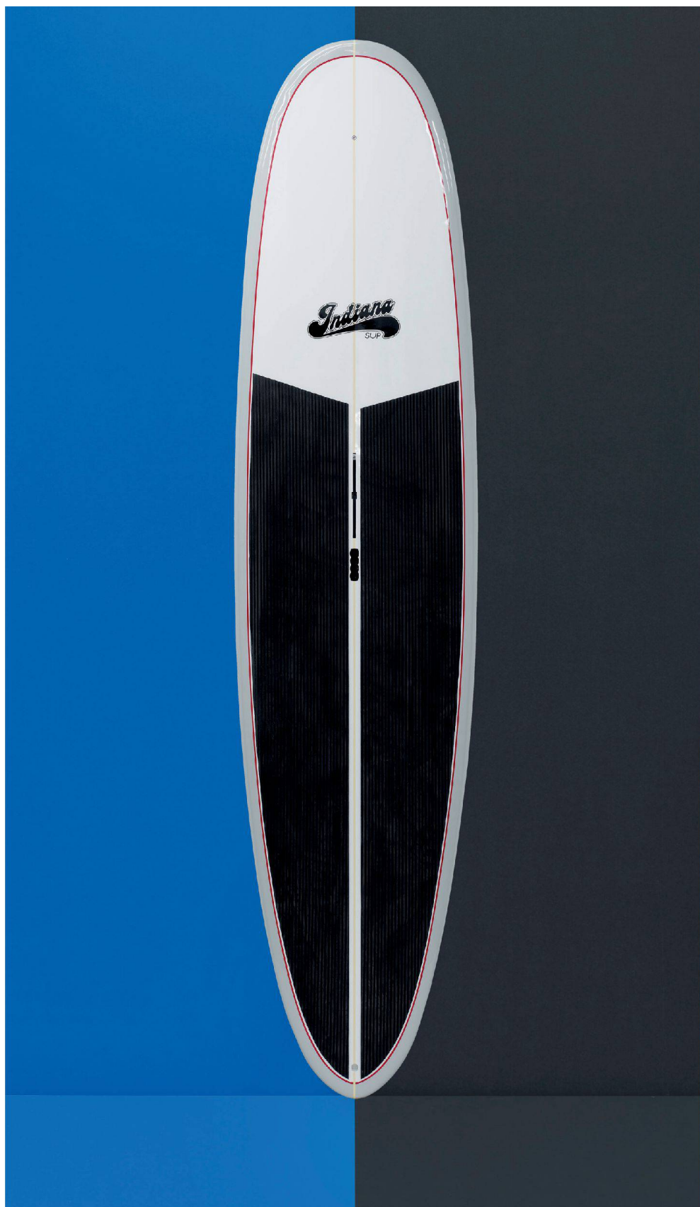
^«Aloha Hawaii» auf dem Zürichsee: auch wenn die Wellen fehlen.