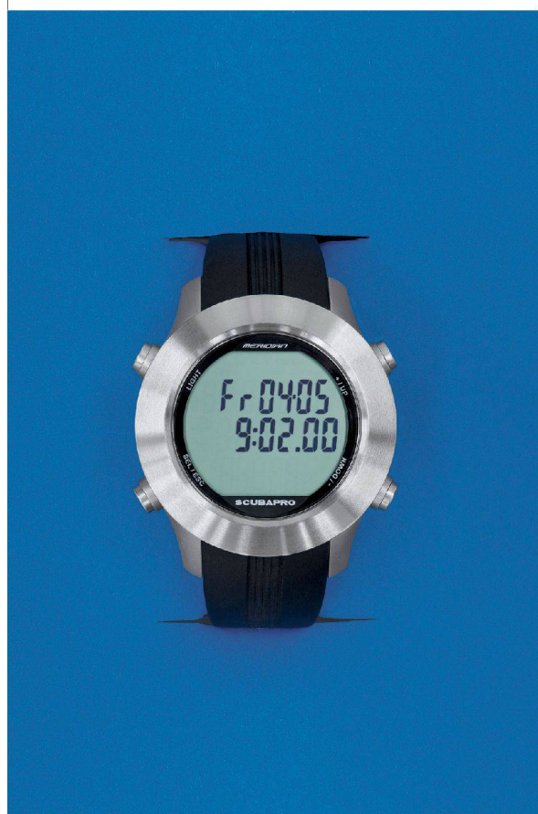
<So sieht der Tauchcomputer als Armbanduhr aus, bevor er in die Tiefe sinkt.