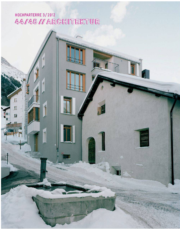
<Die Ches'Immez, die Neuinterpretation des Engadinerhauses, ist mit dem umgebauten Stall verbunden.