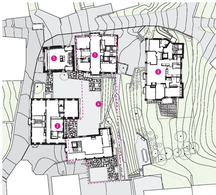
^ 1. Neubau im Stile Engadinerhaus, 2. Chesa Melna mit Anbau, 3. Chesa Sur (Palazzo), 4. Einstellhalle, 5. bestehender Stall (Talvo)