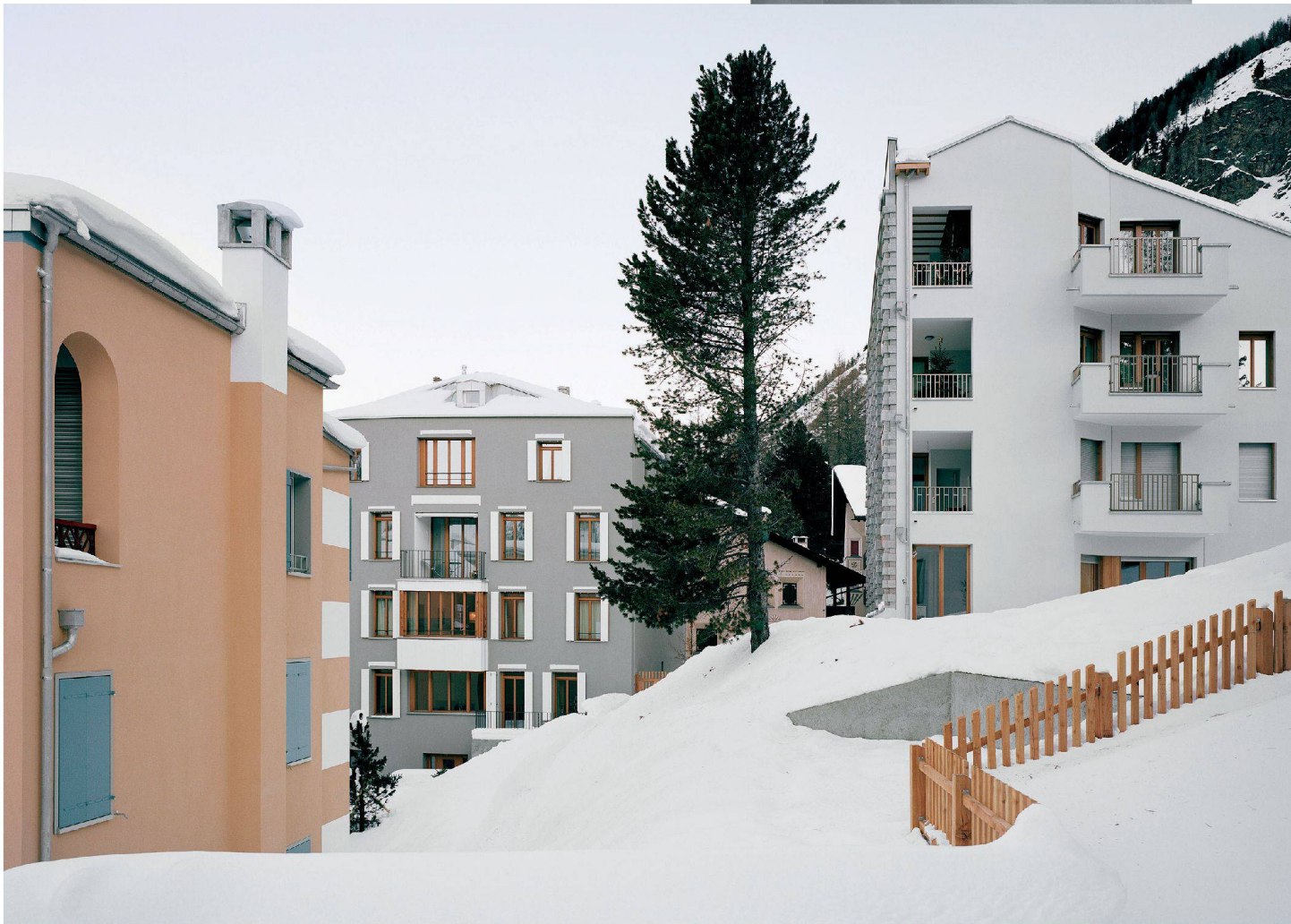
^Die drei Neubauten bilden einen gemeinsamen Hofraum, links der neue Anbau an die Chesa Melna, rechts der Palazzo.