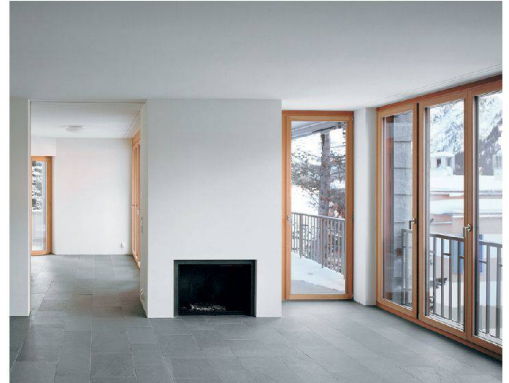
∨Eine Wohnung der palazzoartigen Chesa Sur.