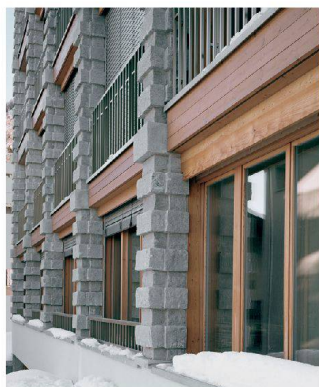
«Rustikale Kraft: die Fassadenpfeiler der Chesa Sur.»

» mittlerweile das originale Engadiner Bauernhaus in Verruf? Doch fand sie eine überzeugende Form, sowohl den Grundrisstyp als auch den historischen Fassadenschmuck neu zu interpretieren. Auf jeder Etage findet sich eine individuelle Wohnung. Gleich ist die lange Halle in der Mitte, begleitet von knappen seitlichen Räumen. Die grossen Öffnungen und Erker der Hallen richten sich als grosse Fenster oder Erker zum Hof und zur steilen Gasse und geben dem Haus ein symmetrisches, fast venezianisches Gesicht. Alle vier Wohnungen blieben im Besitz von zwei der vier Bauherren. Insgesamt gehört mehr als die Hälfte der Wohnfläche der drei Neubauten und des Altbaus zu Erstwohnungen, wie es in Pontresinas Kernzone Vorschrift ist.