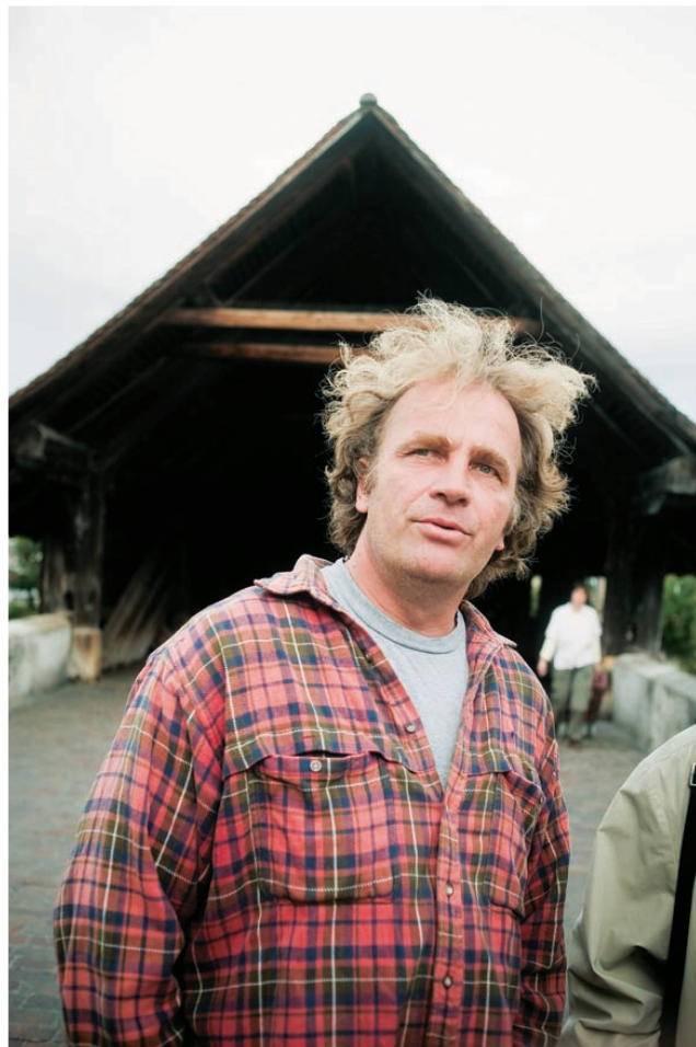
^Schriftsteller, Lokalpolitiker und Stadtführer Alex Capus.