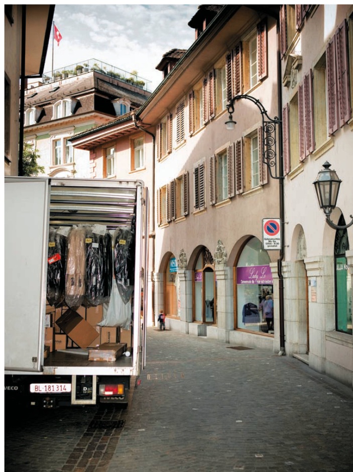
^ Boutiquen und kleine Geschäfte prägen auch Oltens Innenstadt. Warenumschlag am Graben.