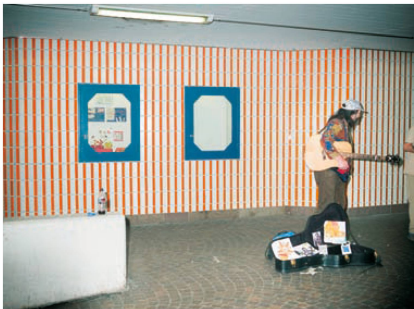
^Das bisschen Leben in der Winkelunterführung täuscht darüber hinweg, dass dieser lange und dunkle Schlauch nicht sehr einladend ist.

>Wer sich durch Olten bewegt, muss immer auch die Eisenbahn querern. Locker geht das hier am Postplatz vor allem für die Autos.