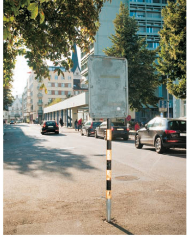
^Munzingerplatz: Hier hätte ein unterirdisches Parkhaus entstehen sollen mit einer Begegnungszone auf dem Deckel. Das Volk wollte nicht.