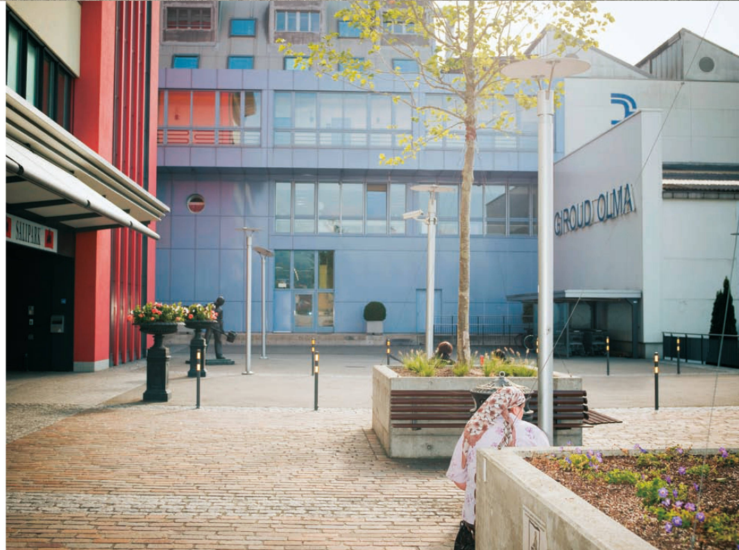
>Die einstigen Maschinen- fabrik Giroud Olma. Die Neunutzung ist noch nicht abgeschlossen.