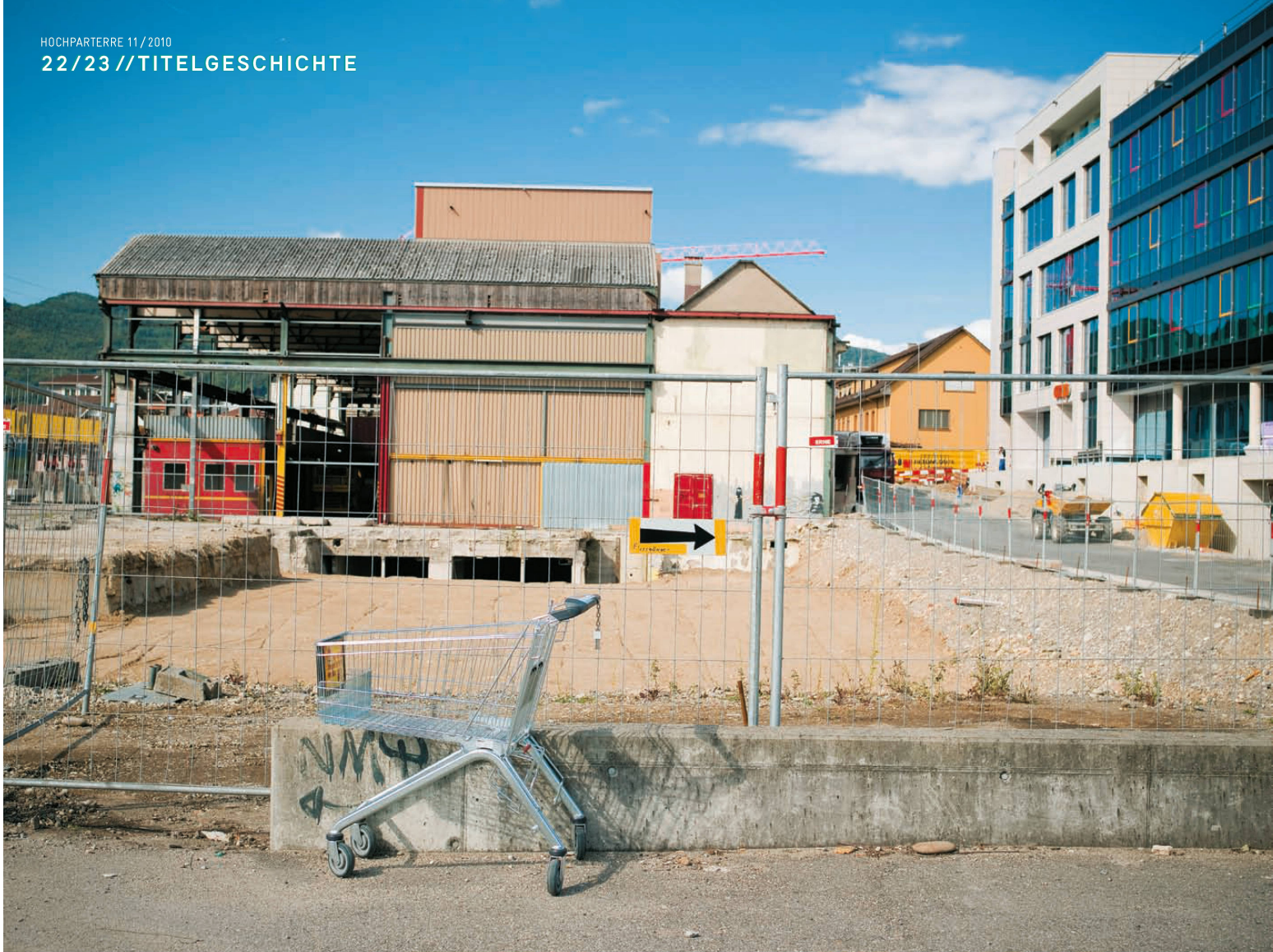
^Früher wurde in der Innenstadt eingekauft. Heute in den Shoppig-Center in Olten Ost.