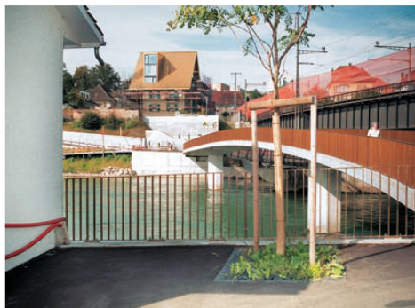
^Die neue Fussgängerbrücke über die Aare mit ihrem «goldenen Geländer» wird akzeptiert, während das Haus mit seinem Golddach für rote Köpfe sorgt.