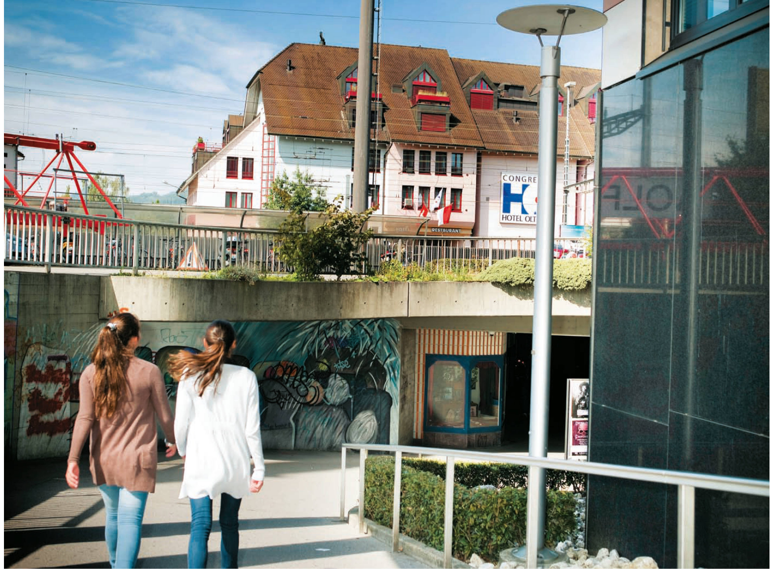
^Eingang Ost der Winkelunterführung. Niemand ist glücklich mit dieser Variante für eine Stadtquerung. Doch wie soll dieses Erbe der Siebzigerjahre saniert werden?