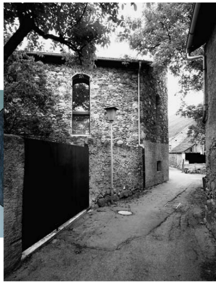
<16_Laas: Der Stadel verrät wenig vom Künstleratelier im Innern.