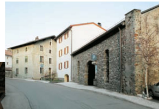
>17_Laas: Vor seiner neuen Nutzung stand der Bärenstadel lange leer.