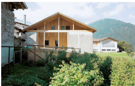
^18_St. Valentin: Umbau statt Abbruch zugunsten eines kanadischen Blockhauses.