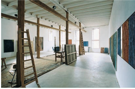
^16_Im Mittelschiff grüsst die alte Tenne mit ihren breiten Brettern.