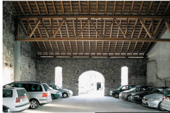
<17_Heute wird das hohe Gebäude als Garage genutzt.