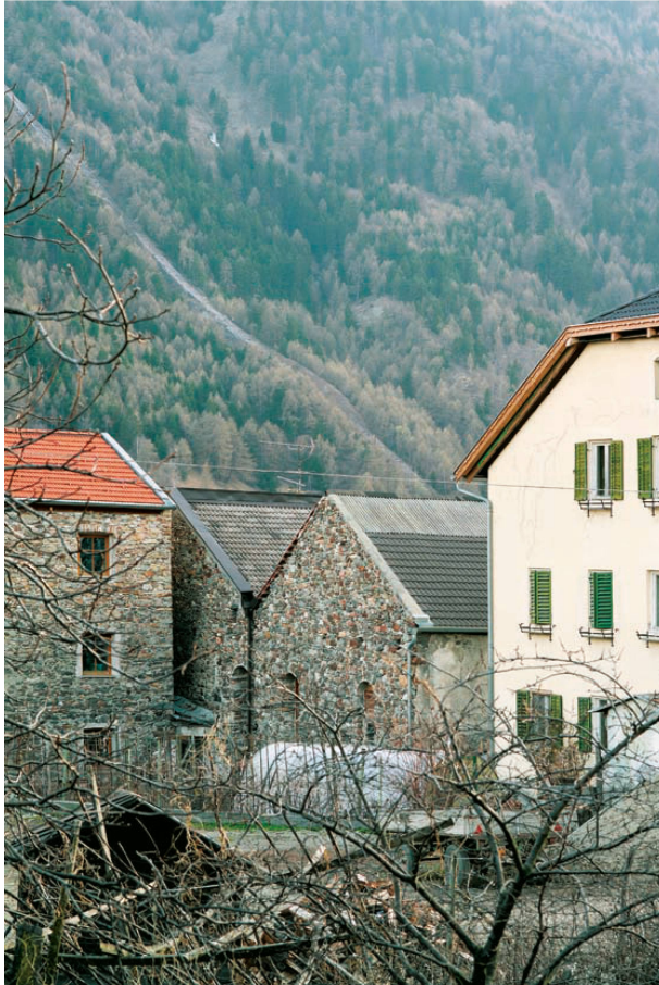
<Laas: Die steinernen Stadel prägen den historischen Ortskern.