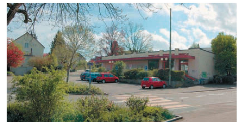
^Früher eine 08/15-Coop-Quartierfiliale.