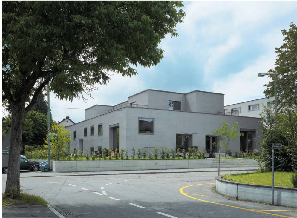
^Heute ein schickes Mehrfamilienhaus in Winterthur.

Was hat EM2N bewogen, diese Firma zu gründen und selbst zu investieren? Daniel Niggli: Es gibt zwei Gründe: Zum einen sind wir so selbst Bauherr und nicht einfach Befehlsempfänger. Zum anderen macht es für uns auch finanziell >