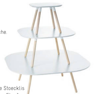
>11_Sibylle Stoecklis Etagère.