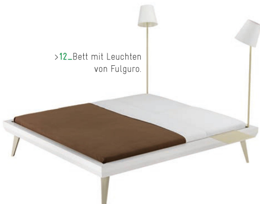
>12_Bett mit Leuchten von Fulguro.