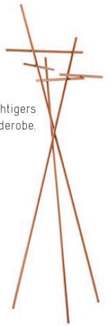
>7_Andreas Bechtigers Garderobe.