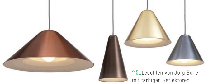
^5_Leuchten von Jörg Boner mit farbigen Reflektoren.