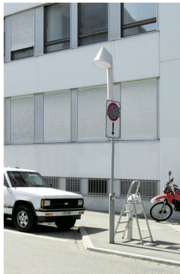
^ Mit Kartonmodellen haben sich die Designer an die richtige Gösse herangetastet.