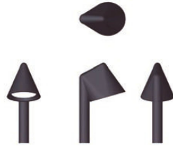
∨ Der Kopf der Strassenleuchte mit Halogen-Metaldampflampe.