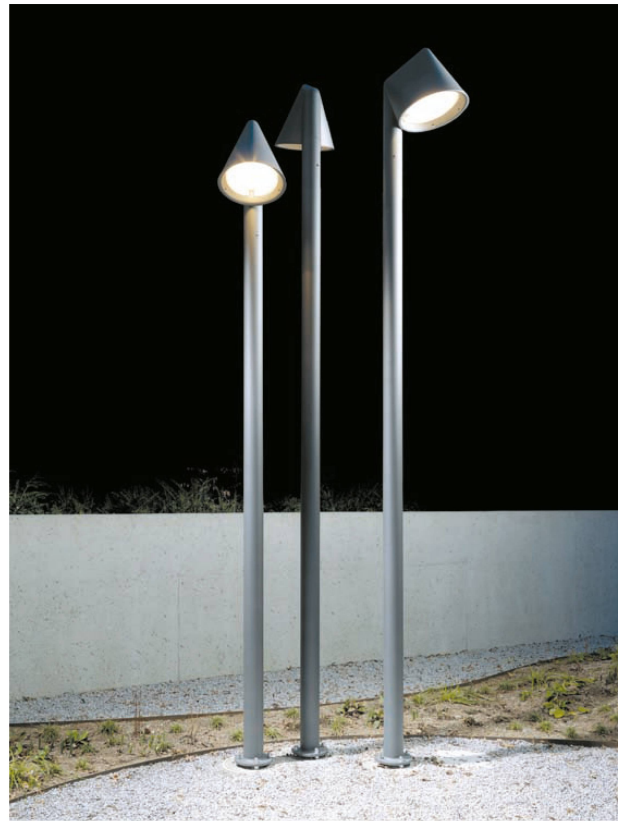
^ Die Leuchten-Geschwister. Im Ganzen gibt es fünf, jede in einer andern Höhe, aber mit gleichem Kopf.