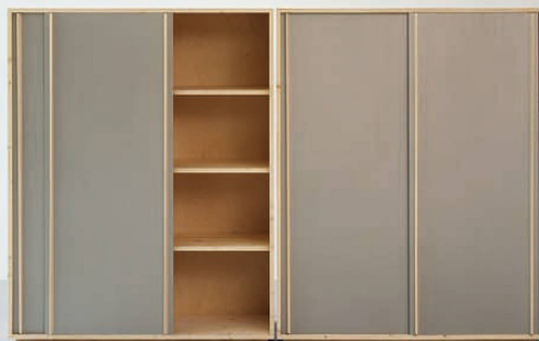
Bild: 2 Schränke, Türen farblackiert.