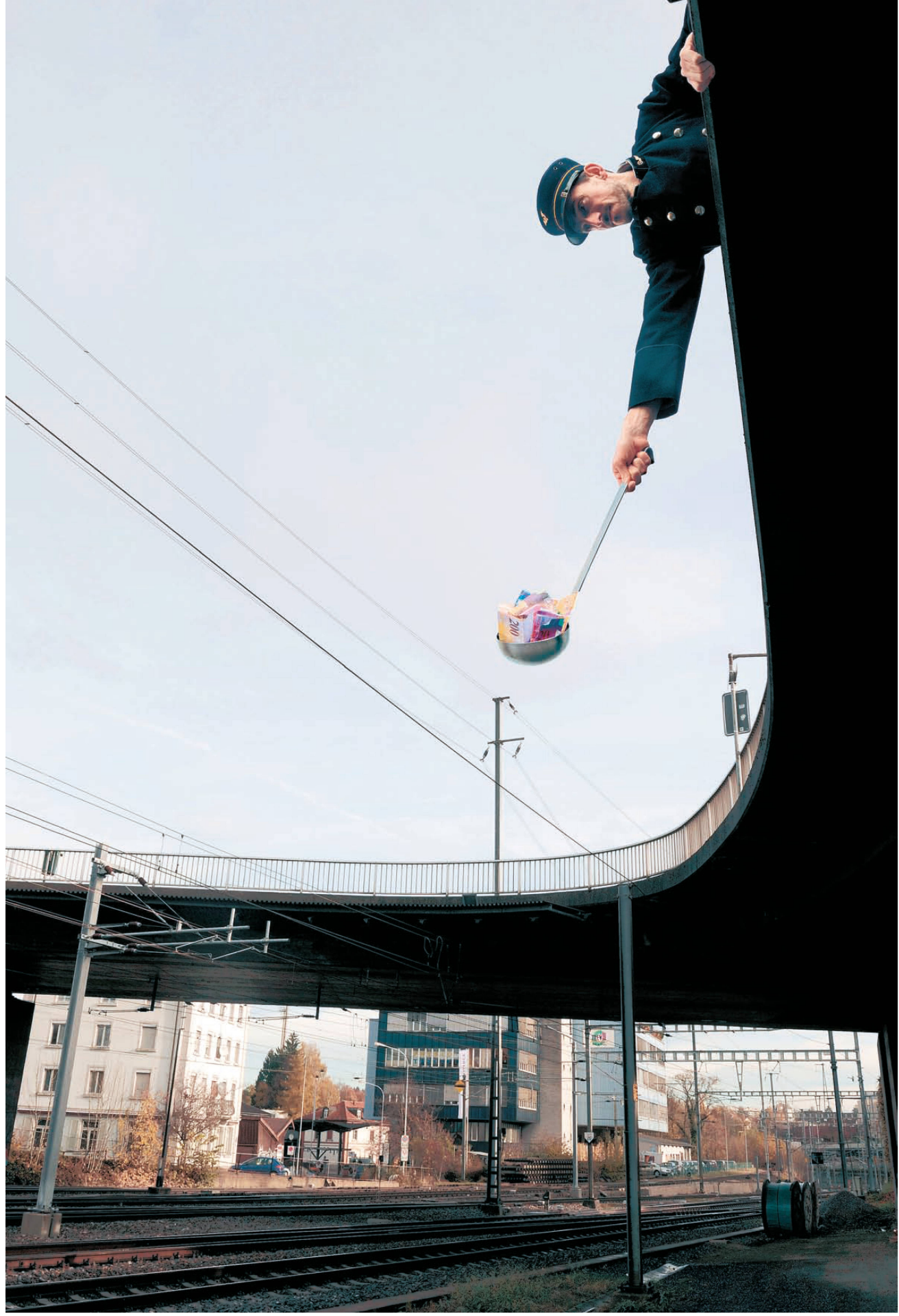
^Wert schöpfen aus Abstellgleisen und Reserveland – denn viele dieser Areale sind zentral, gross und verfügbar.