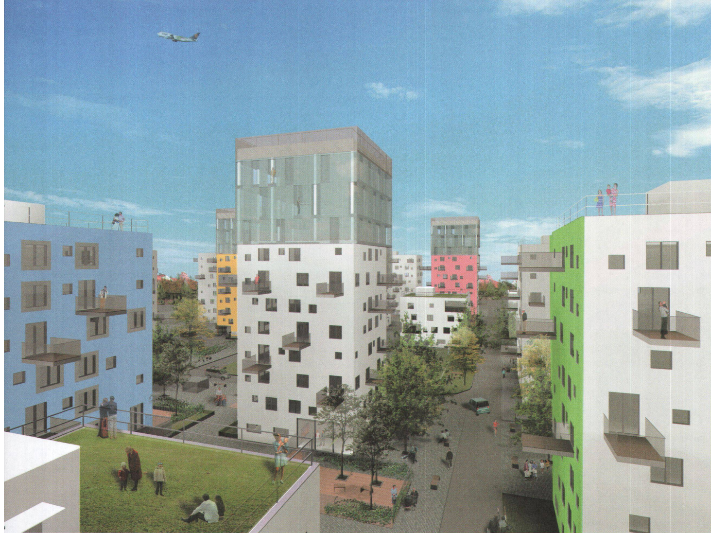
^Mini-Tokio in München: Die Siedlung des bayrischen Werkbunds wird nicht gebaut.