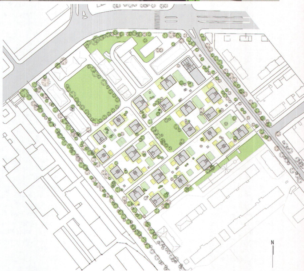
^Situationsplan der Werkbundsiedlung in München. Bilder und Plan: Atelier Kazunari Sakamoto