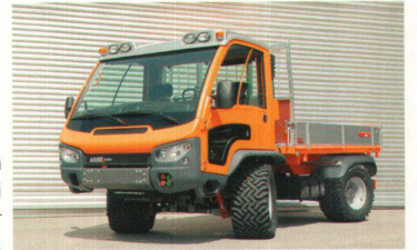
>Market: 35 000 Franken gehen an Paolo Fancelli für den Mehrzwecktransporter «Aebi VT 450».