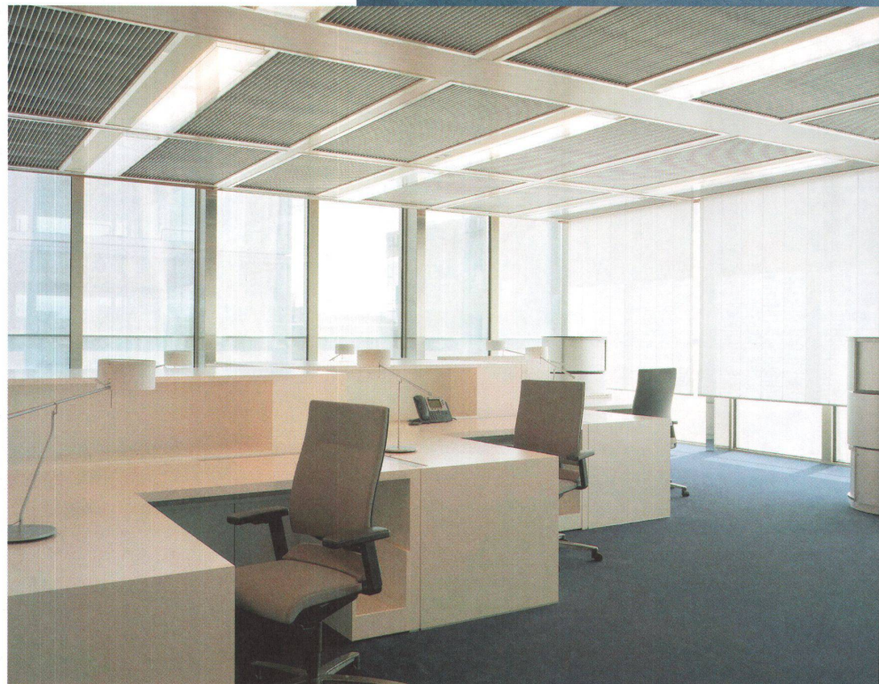
^ Workplace islands: A movable partition is integrated in the synthetic resin desktop.