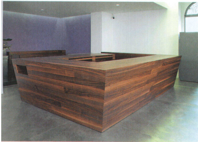
◁ Der Beratungskorpus steht im Zentrum.