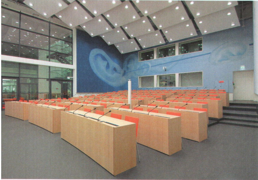
^ Pultreihen für die Medienschaffenden.