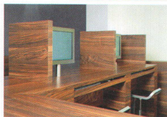
> Trennwände sorgen für Diskretion.