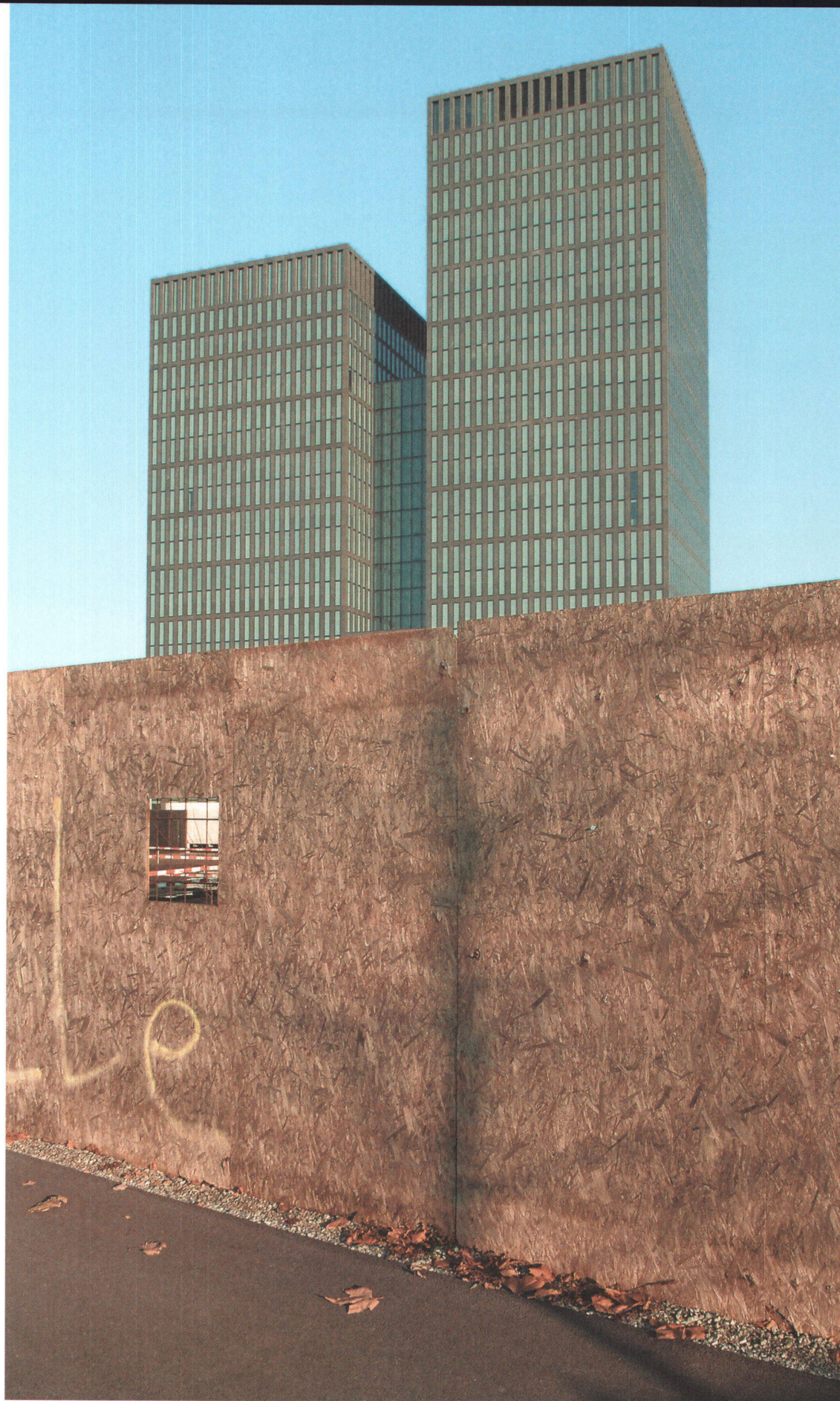
Zürich, Hagenholzstrasse: Die «Sunrise Towers» hat das Hochbauamt im Auftrag der Pensionskasse des Staatspersonals BVK realisiert. Hinter der Holzwand beginnt demnächst der Bau der zweiten Etappe.