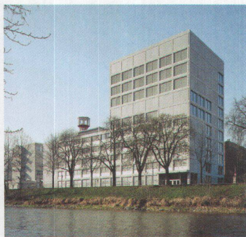
12 TBZ Schulhaus Sihlquai, Zürich

Die typische Karriere eines unermüdlichen Büros geht so: Durrer Linggi nahmen an vier offenen Wettbewerben teil, bis sie eine Präqualifikation schafften. Dann entwarfen sie wieder für zwei offene und konnten schliesslich noch einmal an einem selektiven Verfahren mitmachen: der Erweiterung des Bezirksgebäudes Bülach. Insgesamt hat es für einen vierten Rang gereicht – im Wettbewerb für die Winterthurer Kantonsschulen. Wollen Büros eingeladen werden, hier der Tipp: Möglichst viele offene Wettbewerbe zeichnen. Wenn es ab und zu für einen Preis reicht, steigen die Chancen, dass es auch mal zu einer direkten Einladung kommt. Direktaufträge gibt es nur noch für den Einbau einer Brandschutztür, wie gleich zwei erfahrene Füchse etwas überspitzt meinen. Einziger Trostpreis für viele erfolglose Projekte: Man wird vielleicht auch mal in eine Jury eingeladen. Möglichkeiten zur Teilnahme an Wettbewerben des Kantons gibt es allerdings immer wieder. In den nächsten Jahren werden einige Wettbewerbe ausgeschrieben, mehrere sind bereits in konkreter Vorbereitung. Genug Chancen, um die Rubrik (Wettbewerbe) in der eigenen Bürostatistik zu verbessern. •