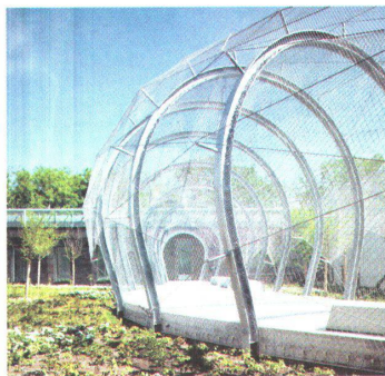
25 Forens. Sicherheitsstationen, Rheinau

--> Auftraggeber: Bildungsdirektion, ZH --> Architektur: Leuppi & Schafroth Architekten, Zürich --> Baukosten (BKP 1-9): CHF 5,58 Mio. --> Ausführung: 2004-2005