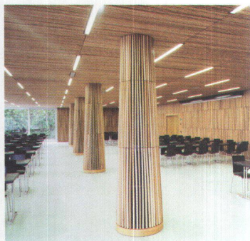
15 Mensa Kantonsschule, Wetzikon

--> Auftraggeber: Bildungsdirektion --> Architektur: Stücheli Architekten, ZH --> Kunst: Daniel Roth, Alexander Kohm, Karlsruhe --> Baukosten (BKP 1-9): CHF 64,5 Mio. --> Ausführung: 2002-2005