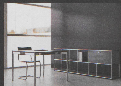
BÜROPLANUNG UND INNENARCHITEKTUR