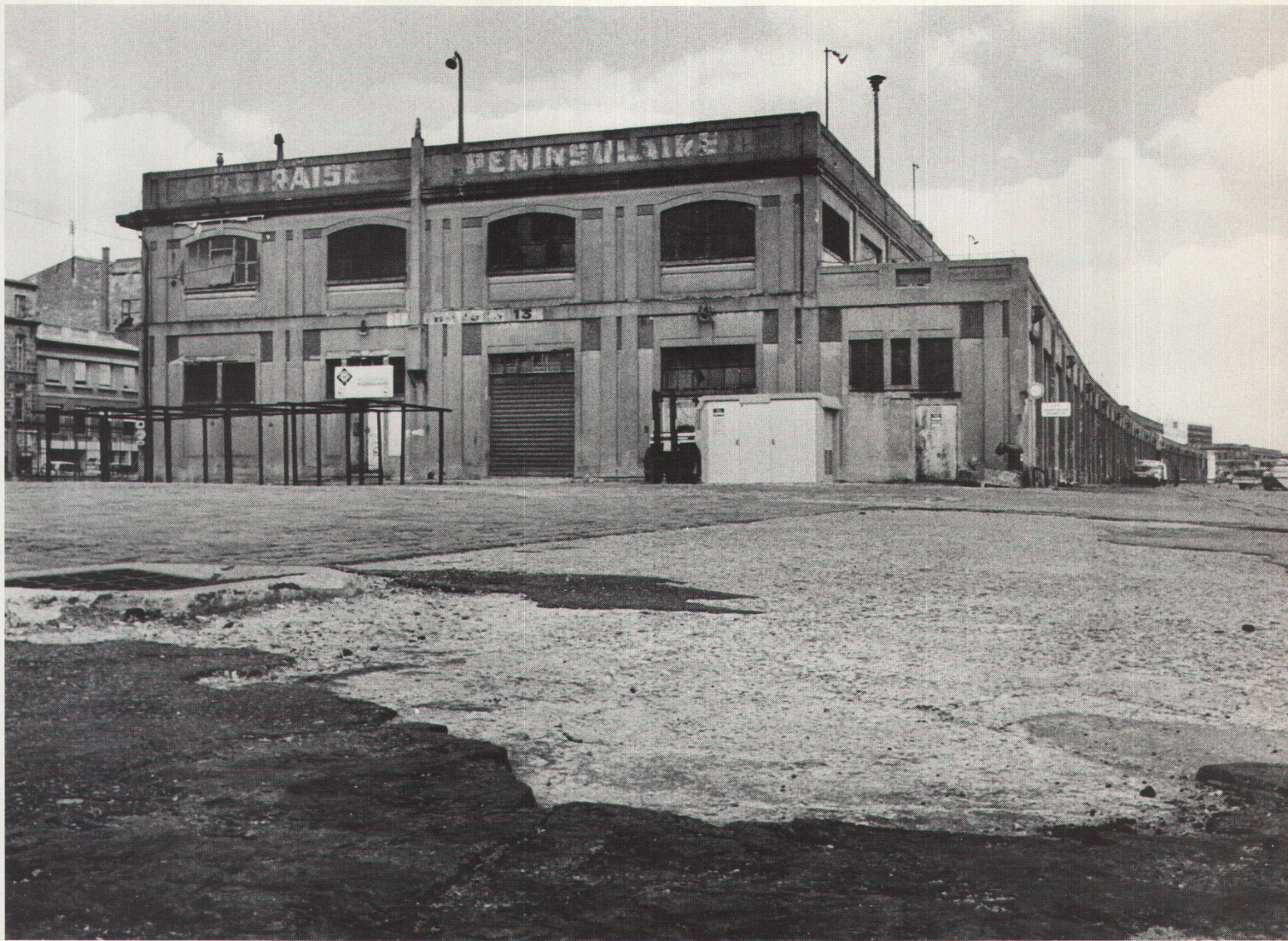
Die alten Lagerhallen der Hafenstadt Bordeaux: Wo einst Weinfässer lagerten, soll in Zukunft Kultur stattfinden

der Bastide und damit für die Gesamtsituation in Bordeaux überhaupt entwickeln.