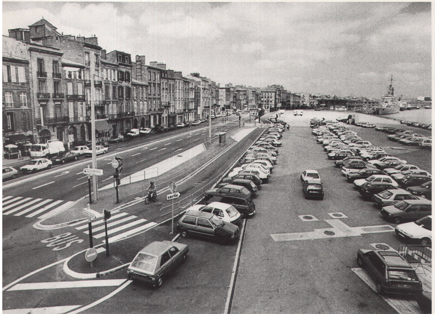
Auf dem linken Ufer der Garonne ist viel Platz für öffentlichen Raum: Es müssen ja keine Parkplätze sein

Der Fluss Garonne bestimmt und teilt die Stadt Bordeaux. Bis zur napoleonischen Zeit führte keine Brücke darüber. Das Wasser musste mit Barken überquert werden. Die Siedlungen entwickelten sich zu beiden Seiten ungleich: links in Fließrichtung zum Beispiel das herrschaftliche Bordeaux mit den Fassaden von der Epoche des Barocks bis zur kapitalistischen Gründerzeit. Sie formen eines der geschlossensten Stadtbilder Westeuropas. Auf der rechten Flussseite befinden sich dagegen Arbeitersiedlungen und Industrie: das