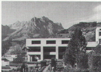
Das Gemeindeschulhaus Engelberg von Ernst Gisel: Ansicht vor der Verschandelung Bild aus Ernst Gisel Architekt, gta Verlag, Zürich 1993

Der Engelberger Gemeinderat geht mit der Zeit. Darum will er auch dem 1965–67 entstandenen Schulhaus, das zu den wichtigen Bauten Ernst Gisels gehört, eine Schlafmütze überziehen. «Verbesserung des äusseren Erscheinungsbildes sowie Integration in die Landschaft» ist eines der Sanierungsziele. Die Kuster + Infanger Architekten AG aus Engelberg zeigt uns