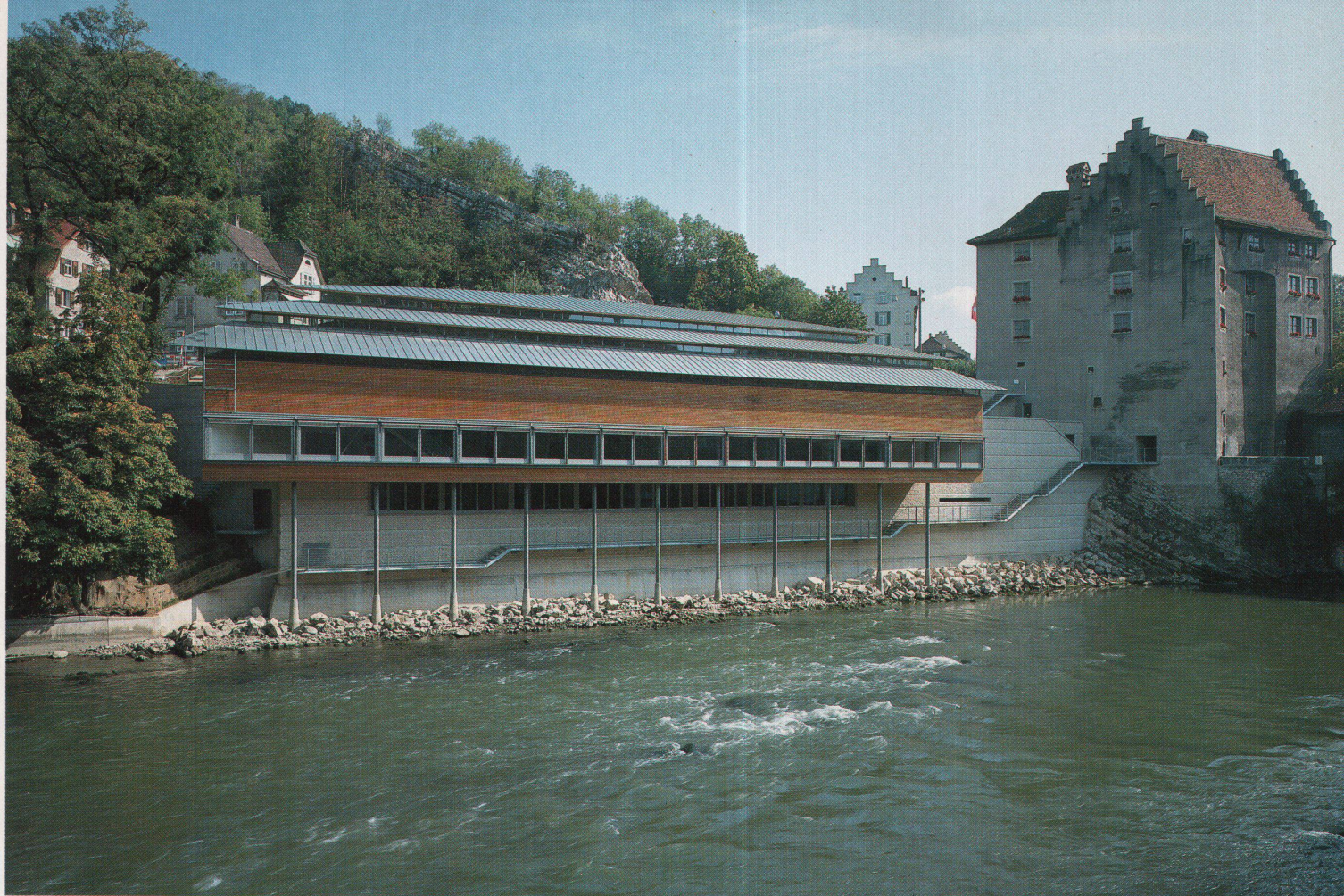
Das neue historische Museum in Baden: darüber die Felsen der Lägern, rechts das Landvogteischloss mit der Holzbrücke

Schnitt und Unterbau sind klar getrennt: unten die lägergraue Betonwand mit dem angehängten Schiffssteg des Uferwegs als Sockel, oben die braune Holzwand mit Längsfenster und dünnen Säulenbeinen.