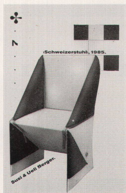
Schweizerstuhl, 1985. Sueli & Ueli Berger.