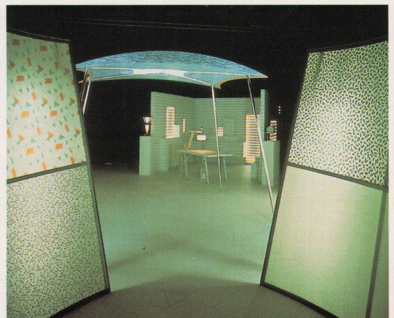
Dekorative Möglichkeiten mit Licht und Formen

Cadsana-Büromöbel-Vertrieb AG, 8952 Schlieren