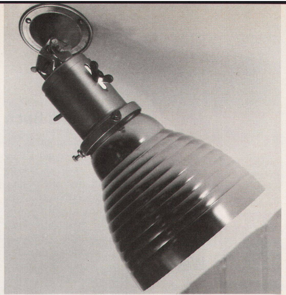
Reflektorleuchte aus Aluminium